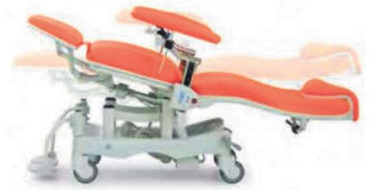
Posizione Trendelenburg inclinazione piani 0° / -15°