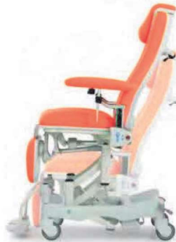
Altezza variabile elettrica escursione sedile 530÷840 mm