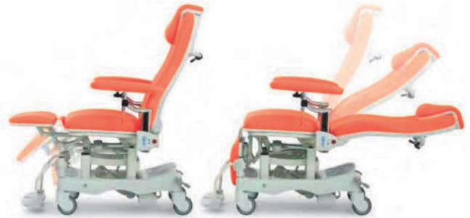
Inclinazione schienale elettrica 105° / 178° Inclinazione gambale elettrica -90° / 6°

Peso 70 kg Fabbricazione Italia Garanzia 2 anni