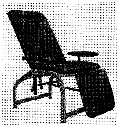
Immagine indicativa illustrativa