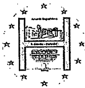
FIGURE PROFESSIONALI NECESSARIE AL PROGETTO